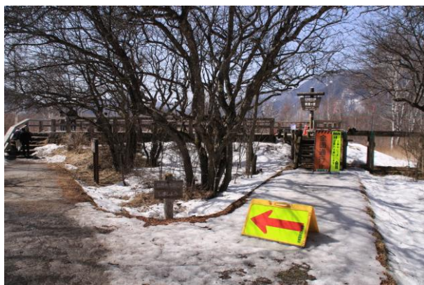
3/11 三本松園展望台車椅子通路工事 (~3/24)