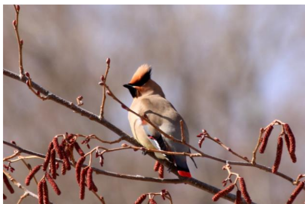
3/11 ヒレンジャク (戦場ヶ原)