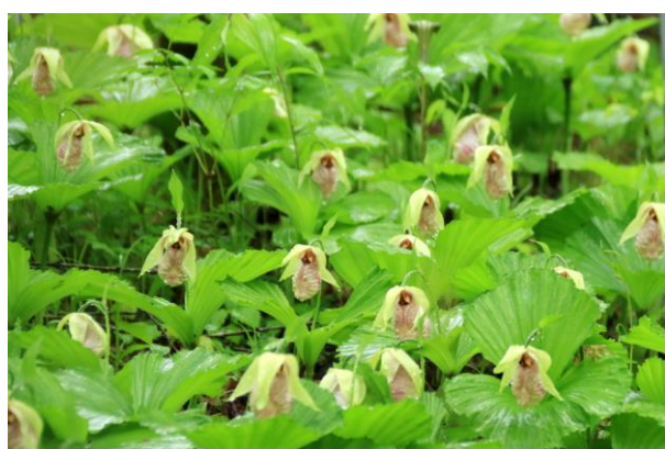
4/26 クマガイソウ見頃（日光植物園）