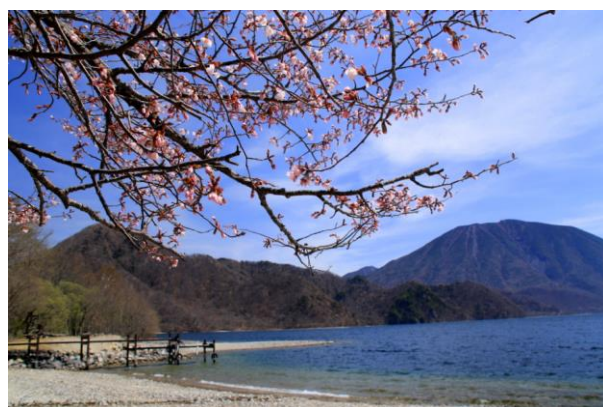
4/29 オオヤマザクラ見頃目前（千手ヶ浜）