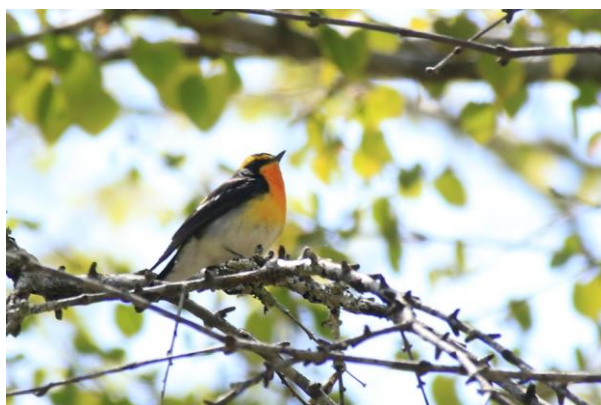
5/9 キビタキ (湯滝観瀑台)