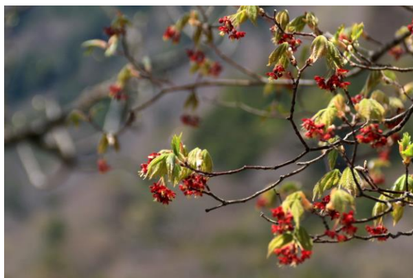
5/9 ハウチワカエデ (湯ノ湖)