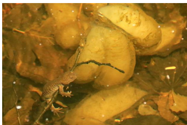
5/9 クロサンショウウオと卵塊 (湯滝付近)