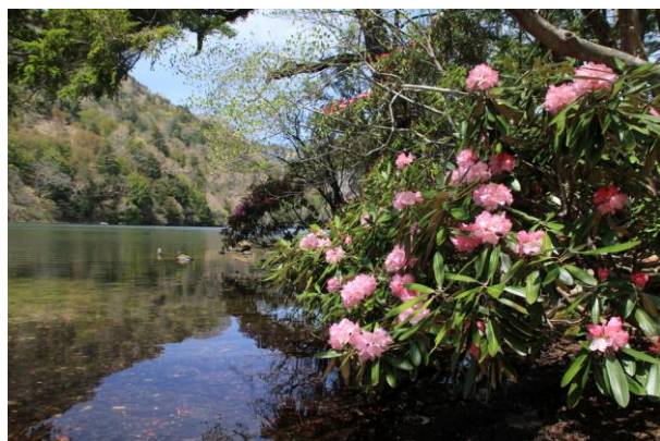
5/9 アズマシャクナゲ見頃 (湯ノ湖)