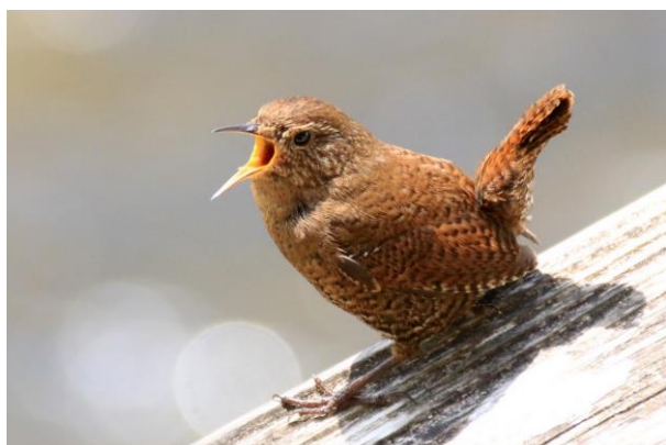
5/9 ミソサザイ囀り (湯滝観瀑台)