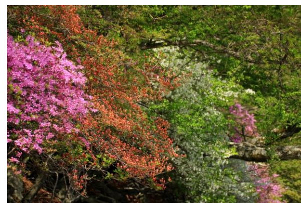
5/18 ツツジ共艶 (中禅寺湖畔 熊窪)