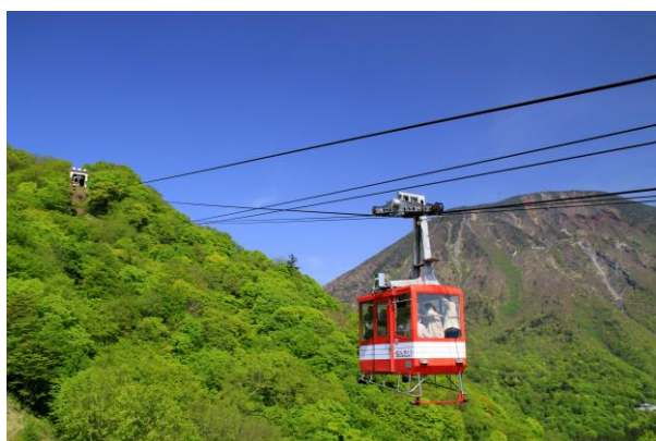
5/17 明智平ロープウェイ