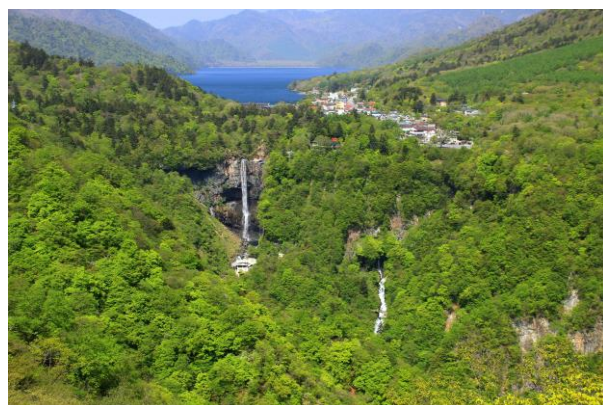
5/17 新緑のグラデーション (明智平展望台)