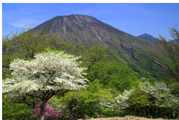
5/17 シロヤシオと男体山 (明智平展望台付近)