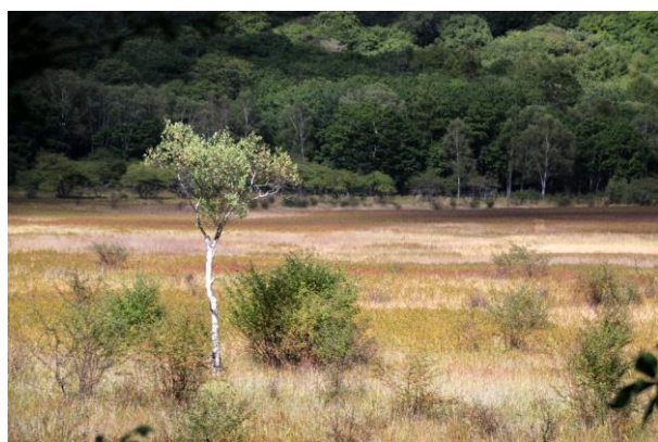
9/29 淡い草紅葉(小田代原)