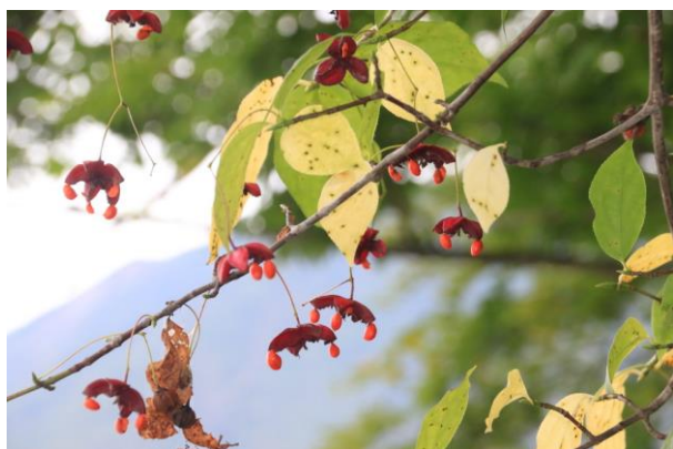
9/24 ツリバナ (イタリア大使館別荘)