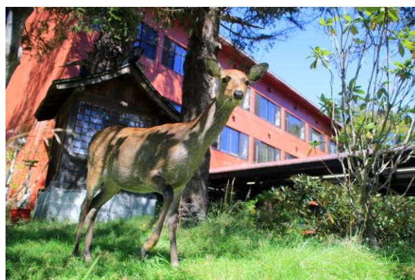
9/29 ニホンジカ (小西ホテル庭)