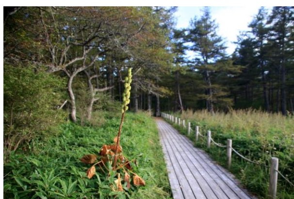
9/26 オオウバユリ実 (小田代原)