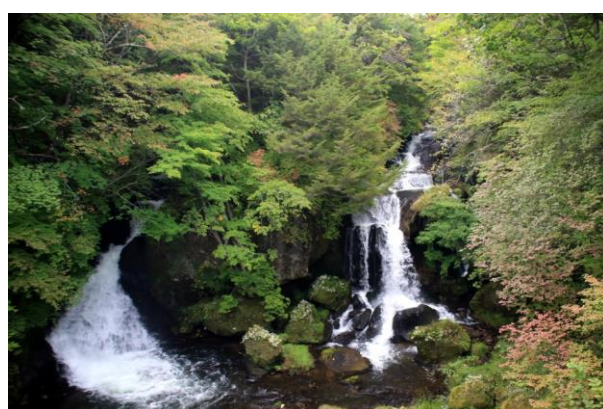
9/27 龍頭滝 色づき始まる