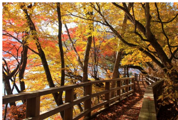
11/3 紅葉の歩道 (中禅寺湖・菖蒲ヶ浜)