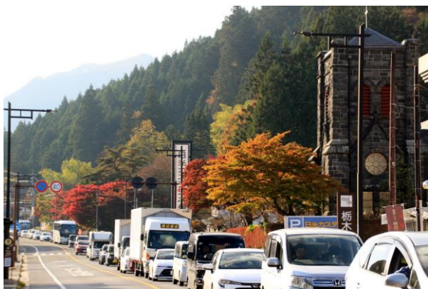
11/2 14:30 国道120号 西参道バス停付近