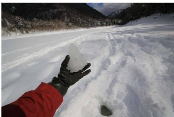
2/8 シャーベット状の氷 (刈込湖)