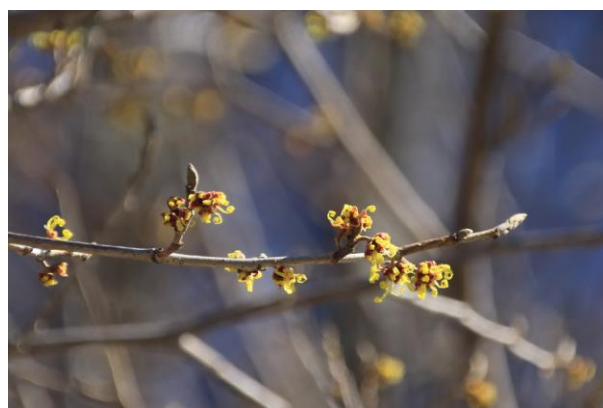
2/17 マンサク 5分咲き (中禅寺湖畔)