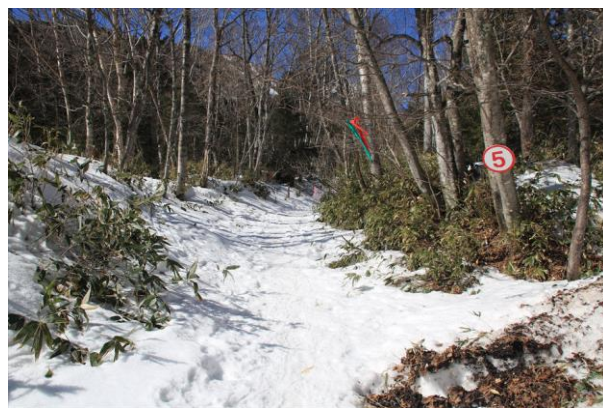
2/17 スノーシューコース入口 (湯元)