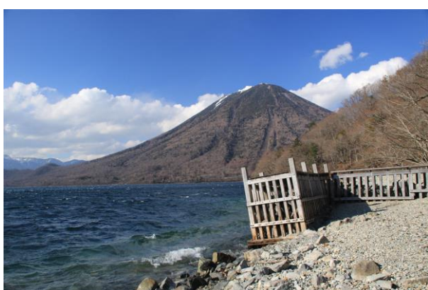
4/1 伊大使館別荘前栈橋傾く（利用不可）