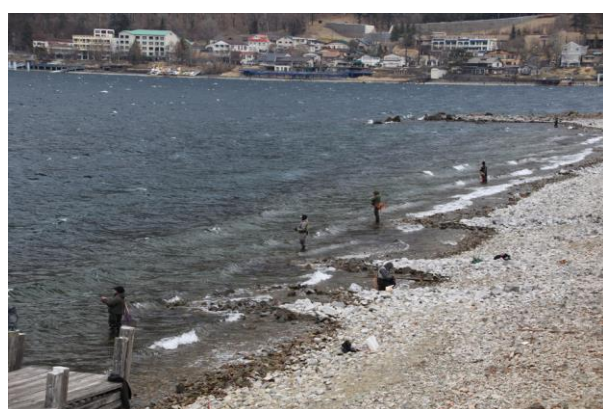
4/1 岸釣り開始（中禅寺湖畔）