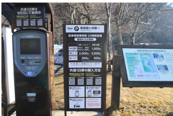
4/1 県営駐車場有料化（歌ヶ浜第一 P）