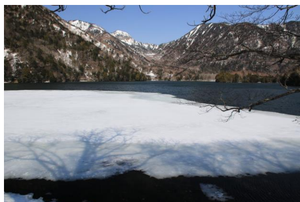
4/2 湯ノ湖 解氷