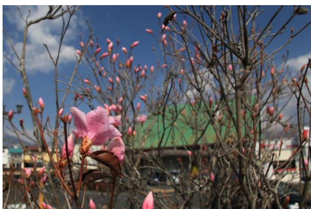
4/1 アカヤシオ開花（東武日光駅前）