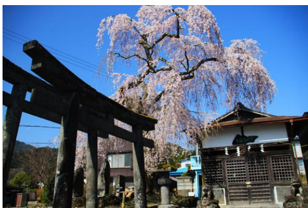
4/13 虚空蔵尊枝垂れ桜（日光市内）