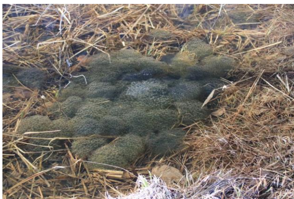
4/13 ヤマアカガエル卵塊（湯元）