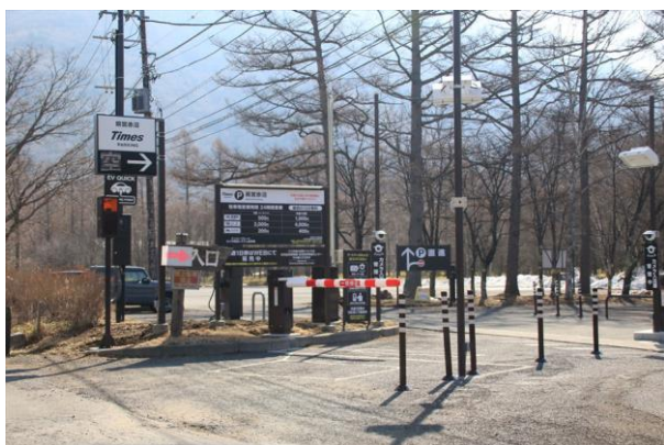
4/12 赤沼駐車場料金徴収開始