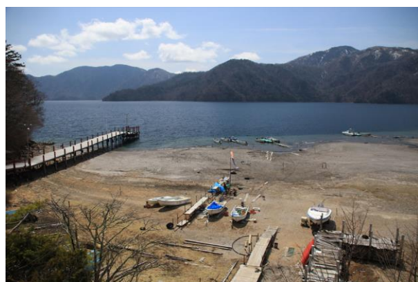
4/13 遊覧船棧橋（菖蒲ヶ浜）