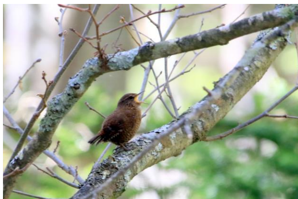
5/15 ミソサザイ (湯滝)