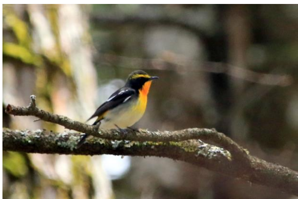
5/12 キビタキ (湯滝の森)