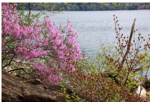
5/15 トウゴクミツバとヤマツツジ (中禅寺湖畔)