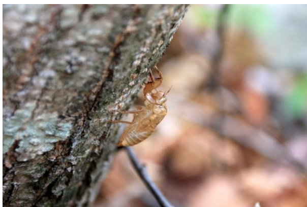
5/15 エゾハルゼミ羽化殻 (中禅寺湖畔)