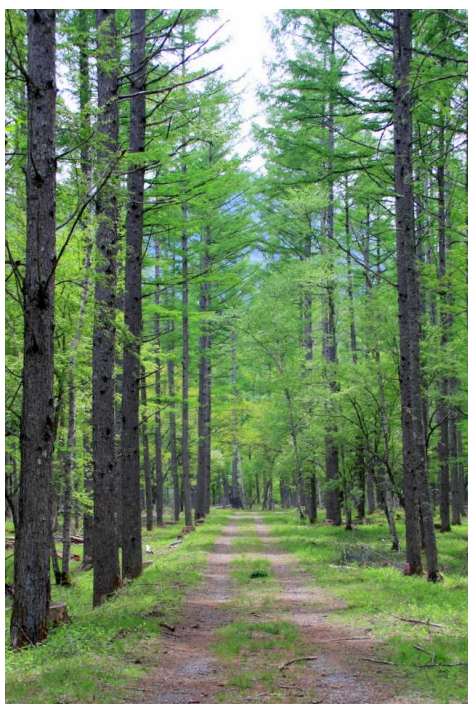
5/23 カラマツの歩道 (西ノ湖)