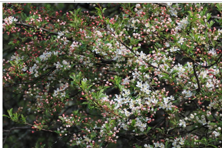
5/23 ズミ開花 (戦場ヶ原 三本松)