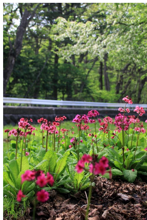
5/23 クリンソウとズミ (菖蒲)