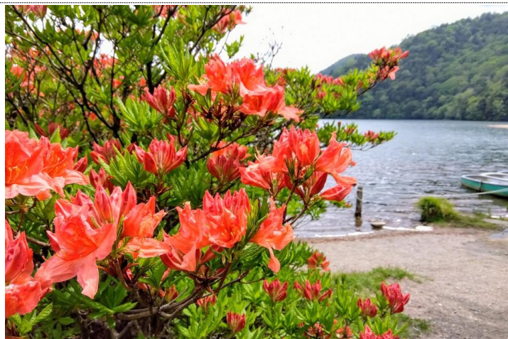
5/30 レンゲツツジ開花 (湯ノ湖)