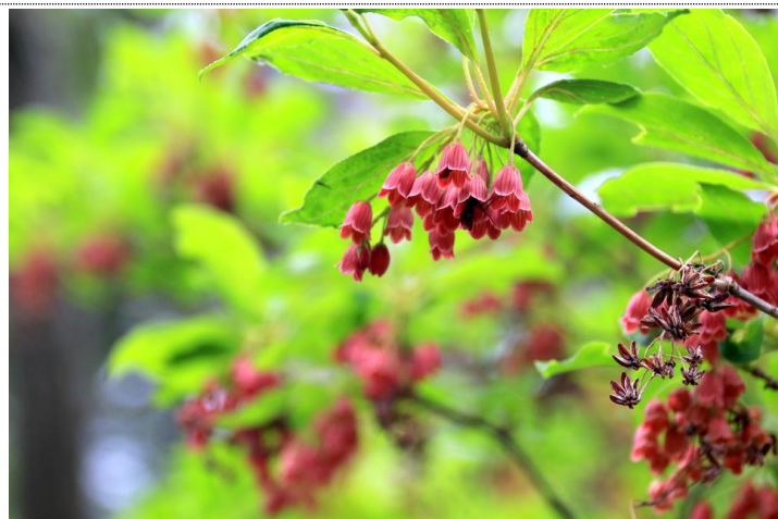
5/30 ベニサラサドウダン (湯ノ湖)