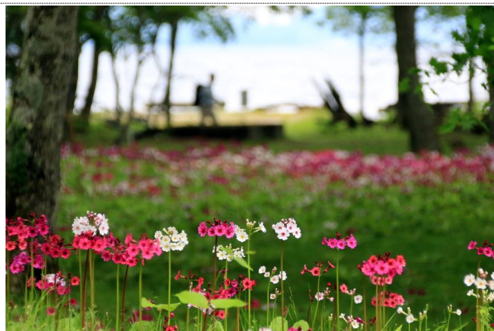
6/1 クリンソウ (千手ヶ浜民家)

【概略】 戦場ヶ原・小田代原では幾分蕾が残るものの、ズミが見頃を迎え、周囲に甘い香りが漂う。ここ数年の中ではかなりの当たり年。ワタスゲも近年としては多くの穂をつけ、風に揺れている。湯ノ湖ではレンゲツツジとベニサラサドウダンが咲く。ベニサラサは著しく花数が少ない。千手ヶ浜では庭先のクリンソウが咲くが、大半が1段目。花茎が伸び、盛りを迎えるのは次週末か。6/1 からモバイルスタンプラリー「皇室・大使の別荘めぐり」が始まった。