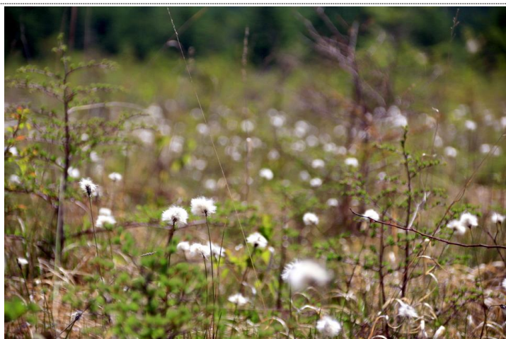
6/1 ワタスゲ瘦果 (戦場ヶ原)