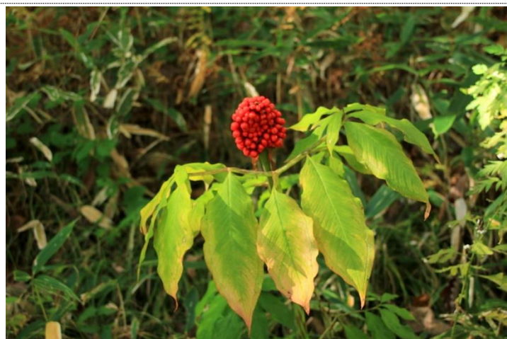
10/12 マムシグサ (小田代原バス停)

【概略】10/10 戦場ヶ原の最低気温が0.8℃になり、初霜初氷が観測された。週頭から急速に冷え込んだ為、紅葉も加速すると予想したが、10/12時点では大きく進展は感じられない。