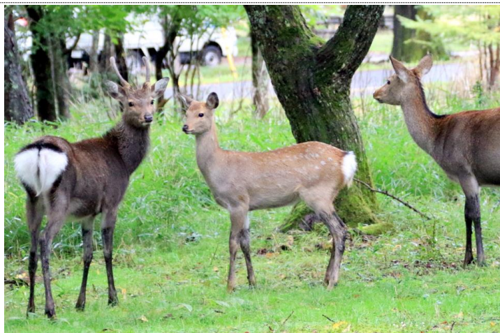
10/9 ニホンジカ ハレム? (湯元地内)