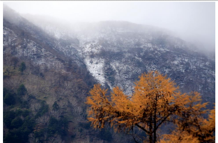
11/6 雪と黄葉 (湯元)