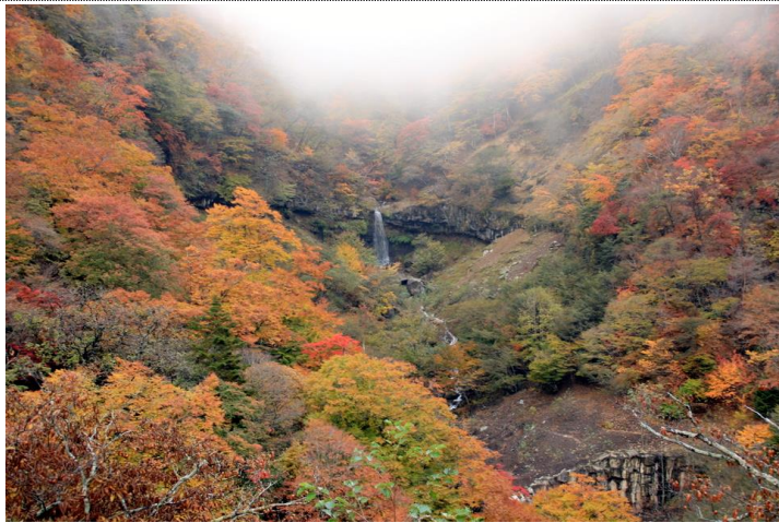
11/6 般若滝 (いろは坂剣が峰)