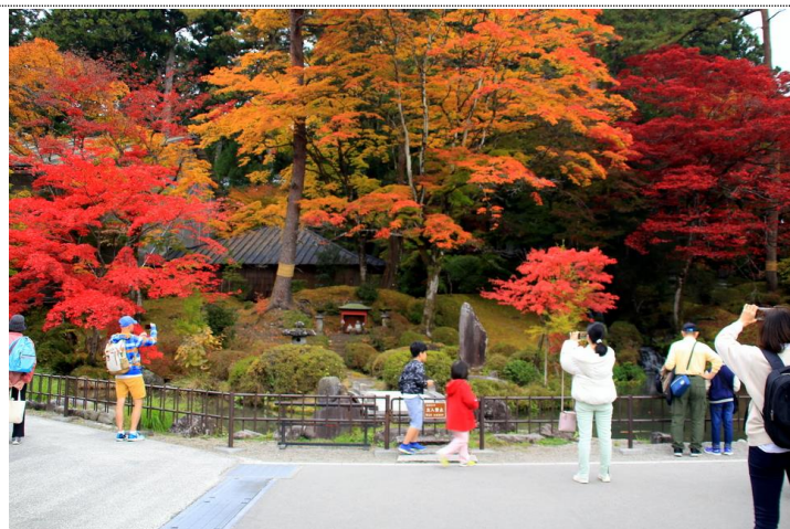
11/14 三仏堂横 (輪王寺)