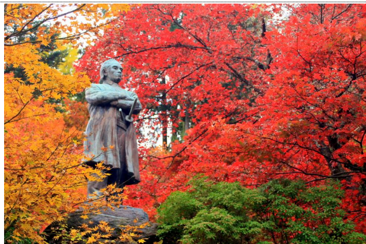
11/14 板垣退助像 (神橋横)