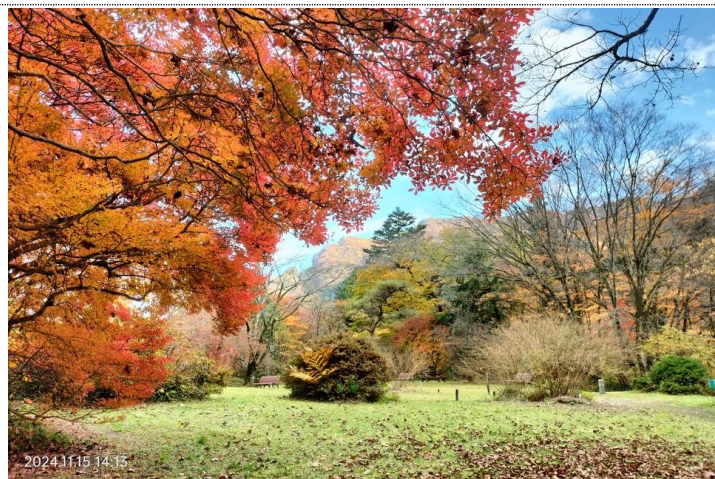
11/15 日光植物園

【概略】 奥日光はカラマツも大半が葉を落とし、中禅寺の植栽木が色を留める程度。初秋に作られていたクマダナ (熊の採食痕) が、葉を落とした森の中でひととき目立つ。今年は数も多いようだ。紅葉は世界遺産群のある日光市街地へ。鮮やかに色づいた木々に道行く人々が各所で足を止め、写真撮影に興じていた。日光植物園や隣接する田母沢の御用邸の紅葉も見頃。世界遺産登録 25 周年を記念した社寺巡りスタンプラリーが行われており、合わせて楽しむのも良い。11/16~11/24 の間、華厳滝のライトアップが行われる。16:30~19:00