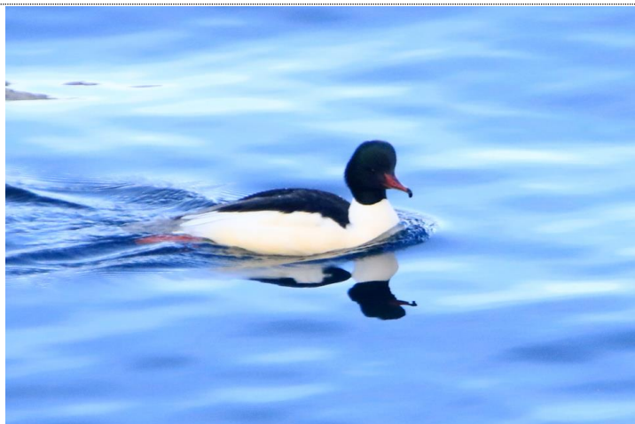
12/25 カワアイサ (中禅寺湖)