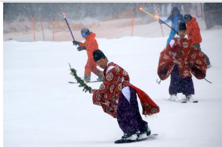
12/24 スキー場開き (湯元スキー場)