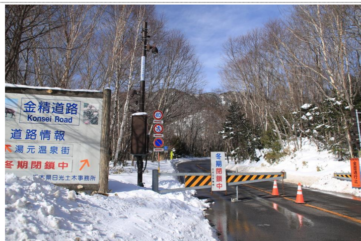
12/25 金精道路冬季閉鎖

【概略】 12/22～12/23 にかけて、最低気温は零下10度を下回り、風速は12m/sを越し、湯元は冬の嵐の様相を呈した。雪は12/24まで降り続き、40cm程の積雪となっただろうか。