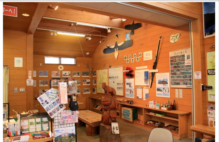
1/12 赤沼情報センター冬季開館

【概略】 年末から降雪の日が多く、湯元地域ではしっかりと積雪となった。1/10 から湯元を起点にしたスノーシューコース (赤：金精の森、青：小峠) が OPEN し、コースに応じた色のリボンが目印となる。石楠花平コース (緑) は積雪が不十分で一部が通過できない為、まだ利用できない。1/11 にはガイドのご依頼を受け、スノーシューでご案内。雪の森をご堪能頂けた様だった。湯元スキー場の第2第3リフトも1/12 から稼働し、全コース滑走可能となった。今期から赤沼自然情報センターが冬季も開館している。10:00~14:30。日付限定の為、事前確認を。