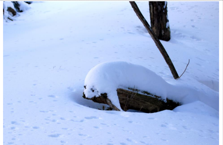
1/11 雪の造形-アザラシ?- (金精の森)