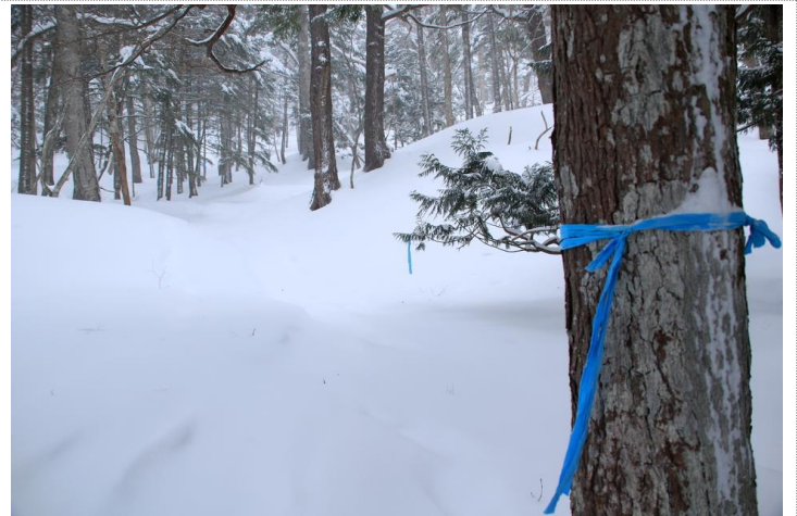
1/10 スノーシューコース OPEN (小峠)