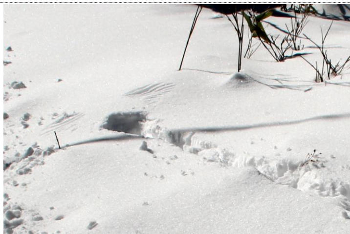
12/6 ヤマドリ？の歩行から飛翔（小峠付近）