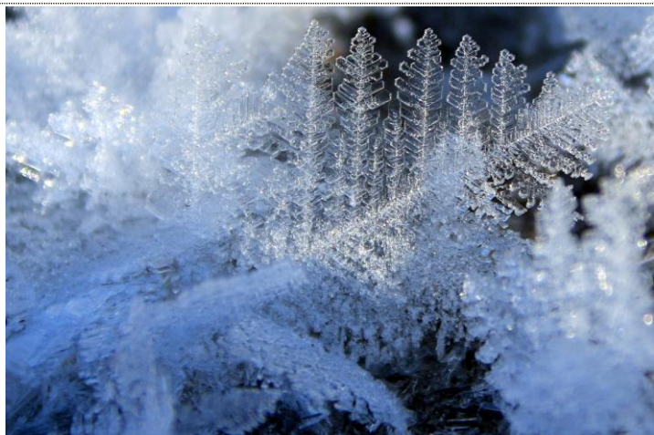
12/6 フロストフラワー（刈込湖）